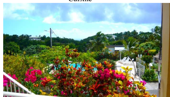
Vue sur la piscine