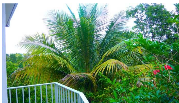
Vue sur le parc